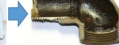
黒錆が形成され、酸化を防ぎ、管を再生